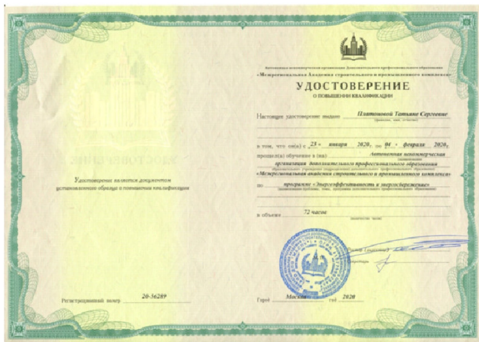
Удостоверение о повышении квалификации специалистов-энергоаудиторов