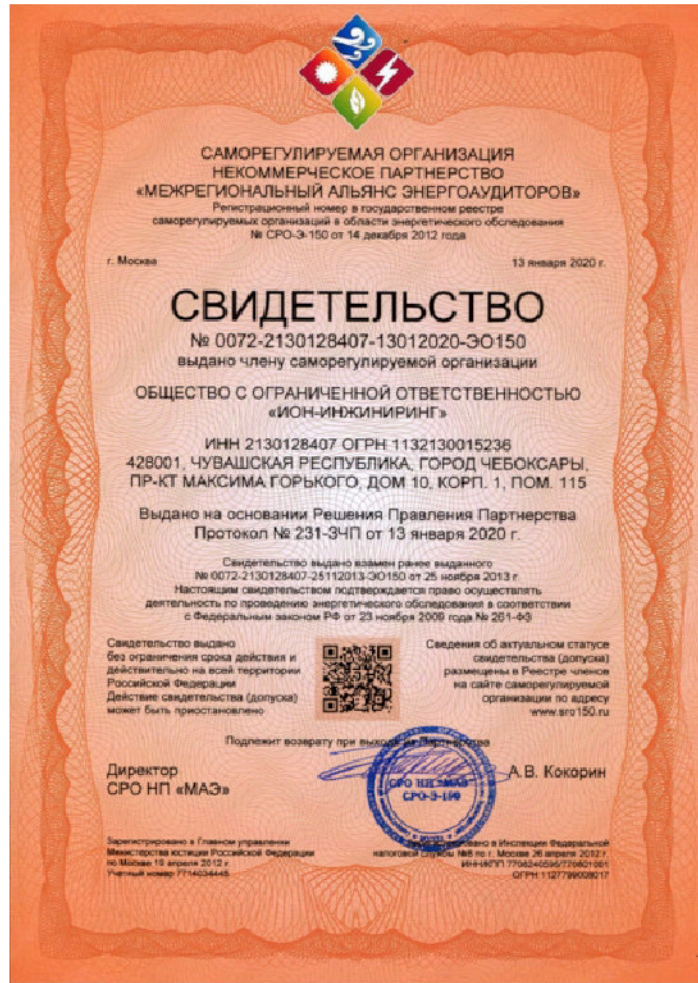
Свидетельство о допуске к работам в области энергетического обследования